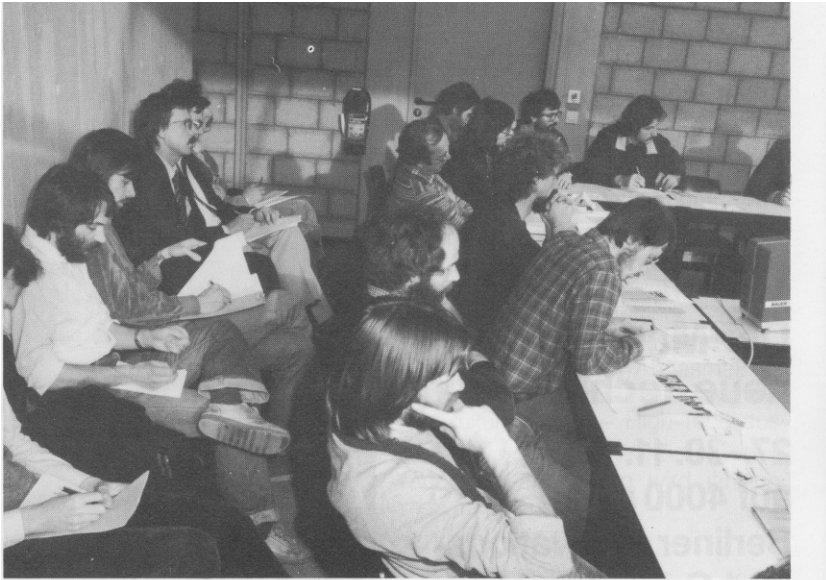
Großes Interesse fand die Seminar-Reihe von TU-transfer zum Thema Spin-off und Unternehmensgründunge

Abb. 3 „Großes Interesse fand die Seminar-Reihe von TU-transfer zum Thema Spin-off und Unternehmensgründungen.“ In: TU-transfer: Innovationszentrum Technische Universität Berlin (1985), TUB Archiv, 712–141, S. 22