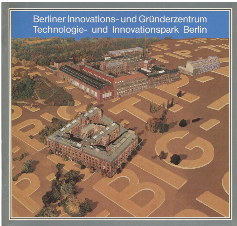
Abb. 2 Berliner Innovations- und Gründerzentrum/Technologie- und Innovationspark Berlin, Presse und Informationsamt des Landes Berlin (1985), Cover

4000 Besucher durch das Zentrum geschleust worden“, notierte die Wechselwirkung . Die davon ausgehende ideologische „Katalysatorfunktion“ sei allerdings nicht zu unterschätzen: schließlich passe das „propagandistische Lieblingskind“ der neueren Forschungs- beziehungsweise Stadtpolitik, dem im BIG ein ideales Zuhause bereitet werden sollte, nur zu gut zur geistigen Situation der Zeit (Schlag 1985: 47–48). Die Organisator*innen einer „anti-militärischen Stadtrundfahrt“, die eher assoziativ auch am BIG vorbeiführte, stellten diesbezüglich heraus, dass hier „Jungdynamische Jungunternehmer [...] mit Steuergeldern neue Technologien bis zur Marktreife [entwickeln]“, unter Rückgriff auf Infrastrukturen der TU, von Risiko und Unternehmertum also eigentlich keine Rede sein konnte (Anonym 1985a, 107–108). 14