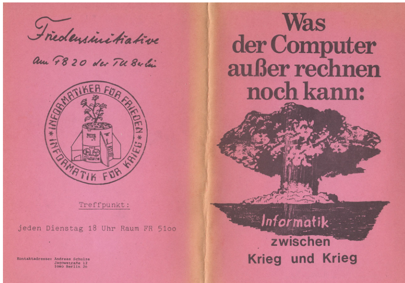
Abb. 5 Friedensinitiative am Fachbereich Informatik der TU Berlin: Was der Computer außer rechnen noch kann: Informatik zwischen Krieg und Krieg, Berlin (1982), Cover und Umschlagrückseite

risierten Weltkrieg die Parameter informationstechnischen Gegenwissens über kurz oder lang in andere Bahnen lenkte. Nach wie vor schrieb sich das Forum (seit 1987: Forum InformatikerInnen) „sozialverträgliche EDV“ auf die Fahnen. Nach wie vor war am inhumanen Menschenbild der Informatik zu verzweifeln (die im Zuge von SDI verstärkt ins öffentliche Bewusstsein tretende „Künstliche Intelligenz“ galt tendenziell gar als dessen Apotheose). Überschattet wurde dieser Diskurs nun aber von den deterritorialiserten Gefahren spätmodern-atomarer Kriegsführung. Die Träume vom Wissen zum „örtlichen“ Gebrauch, von „Betroffenenwissenschaft“ und „Wirtschaftsdemokratie“ gerieten dabei latent unter die Räder; fast zwangsläufig erschöpfte sich der Einsatz für den planetaren Frieden in „destruktive[r] Kritik“ (Grosswiele 1986: 10). 19