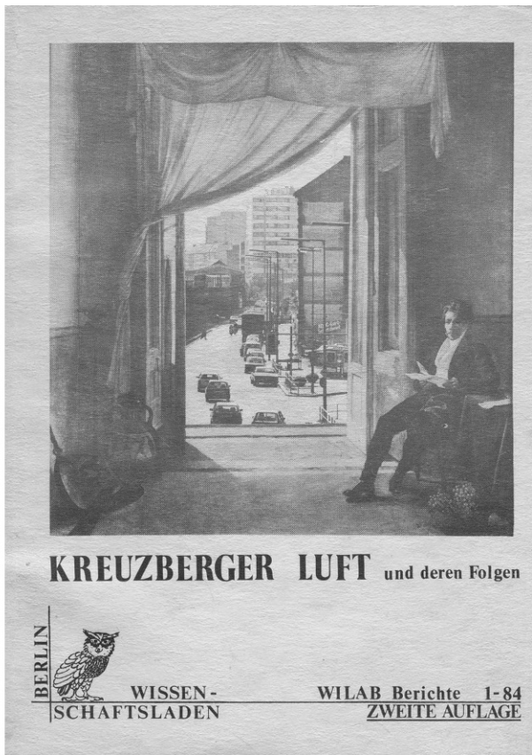
Abb. 4 Kreuzberger Luft und deren Folgen (WILAB-Berichte 1-84), Cover. (Fotomontage: „Schinkel in Neapel“ (1824) von Franz Louis Catel, im Hintergrund der „Kotti“)

durchsichtigen Vergabekriterien (Beuschel et al. 1984: 36). Und schließlich, als „Dauerbrenner“: der Arbeitsbereich „Informationstechnologien am Arbeitsplatz“, wobei das angebotene Dienstleistungsspektrum dem der Transferstelle TU-transfer hier tatsächlich durchaus ähnelte – auch letztere verstand sich in erster Linie als Informations- und Vermittlungsagentur, dazu auserkoren, die vielfältigen „Hemmnisse“ abzubauen, die der engeren Liaison von Theorie und Praxis noch im Wege standen (vgl. Allesch 1981). Ähnlich am WILAB, freilich unter deutlich anderen Vorzeichen und Bedingungen: Anfertigen von (alternativen) Gutachten, Vermittlung von Sachverständigen, Beschaffung von wissenschaftlicher Literatur, Übertragung derselben in „allgemeinverständliche Form“, Diskussionsabende durchführen – all das gehörte mit zum Portfolio (WILAB 1983: 172).